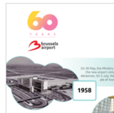
Dress cubes Brussels Airport, Havas