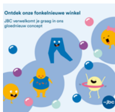
Paneel opening winkel JBC, Wunderman